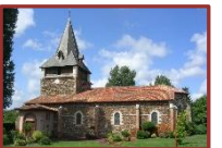
Pontenx-les-Forges (et la chapelle de Bourricos)